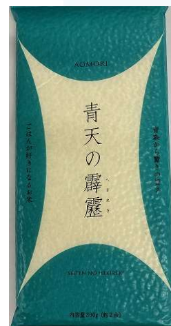
「青天の霹靂」 2合真空パック （非売品）